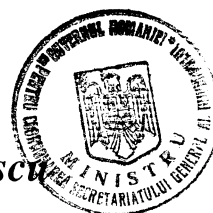
Petru Șerban Mihăilescu